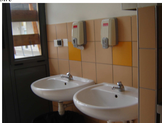
Les lieux où l'on débarrasse et où l'on se lave les mains